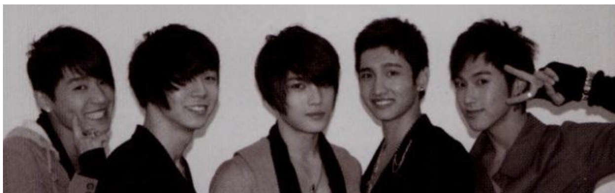
(左から) ジュンス、ユチョン、ジェジュン、チャンソンミン、ユンホ